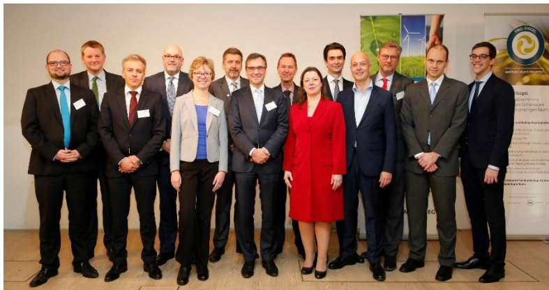
Empfänger der ausgezeichneten FNG-Siegel 2017 Fonds

Am 23. November hat die GNGmbH das FNG-Siegel 2017 im Rahmen einer feierlichen Veranstaltung an 38 nachhaltige Publikumsfonds vergeben. Ausgezeichnet wurden Fonds aus fünf